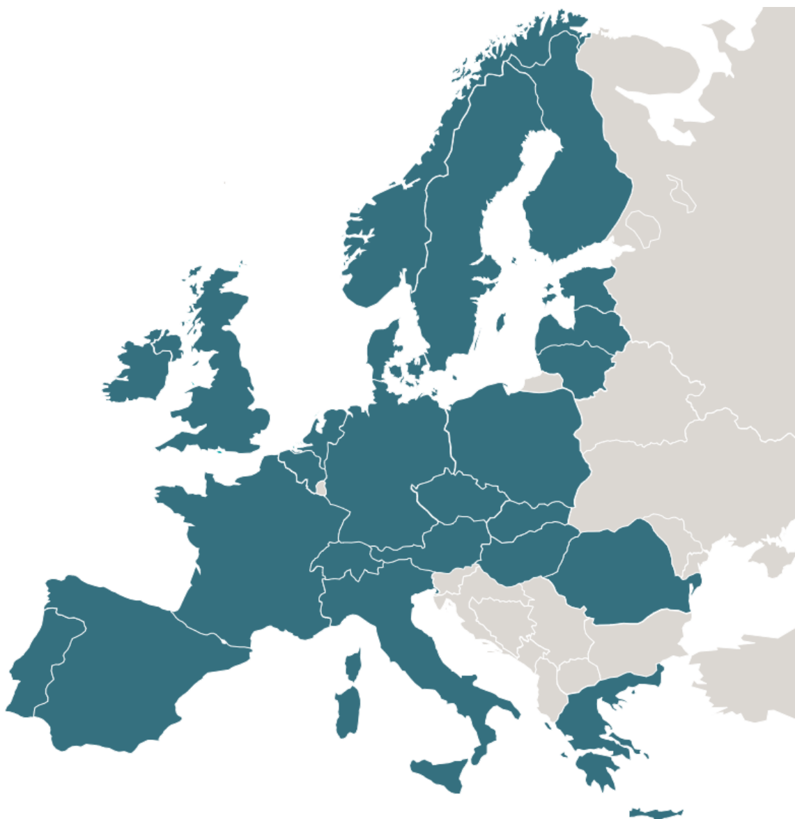
Bild 8.1 Intrums geografiska närvaro i Europa

Intrums breda geografiska närvaro i Europa gör att Intrum kan erbjuda uppdragsgivare ett enhetligt tjänsteerbjudande på flera europeiska marknader.