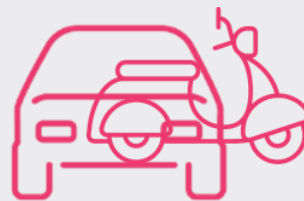
AUTOMOTIVE (CARS + E-BIKES/SCOOTERS)

Kommande lagkrav för förarövervakning (DMS), som använder sig av infraröda kameror för att övervaka förarens uppmärksamhet, skapar ett starkt incitament för att integrera irisigenkänningsteknik i fordon. Samma kamera som används av förarövervakningssystemet kan nyttjas för att belysa ögat med infrarött ljus för att ta en bild av iris och använda Fingerprints autentiseringsprogram, detta utan att behöva lägga till någon extra hårdvara. Fingerprints upplever ett ökat intresse för biometri från fordonsbranschen, t.ex. för att autentisera transaktioner i bilens betalningssystem (s.k. in-car payments) och möjliggöra andra avancerade funktioner, såsom föraranpassning och förhindra att fordonet startar om inte föraren har vederbörligen identifierats. Under 2023 ingick Bolaget ett avtal med en Tier 1-leverantör inom fordonsindustrin, med målet att vidareutveckla Fingerprints irisigenkänningsteknologi så att den smidigt kan integreras i förarövervakning (DMS) för att hantera autentisering.